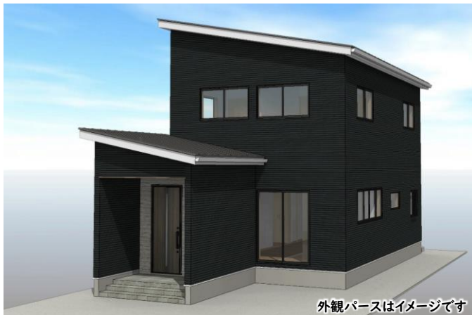
外観パースはイメージです